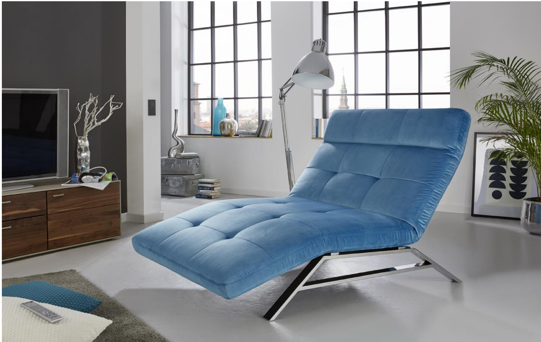
Einzelliege Maxi im Bezug Velvet petrol