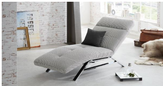
Einzelliege im Bezug Classy black