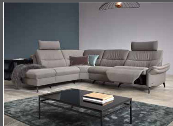
Zusammenstellung 585 / 156 in 24 Q2 Fashion grey