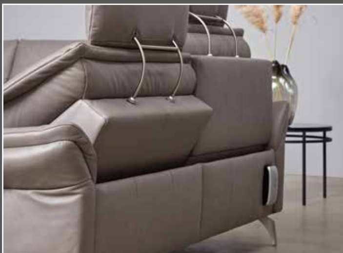
Variante 166 mit beidseitiger Wall-Free-Funktion