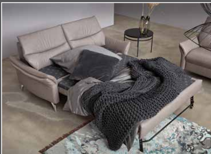
Variante 274 mit Bettfunktion und Armteilverstellung Liegefläche 135x190cm