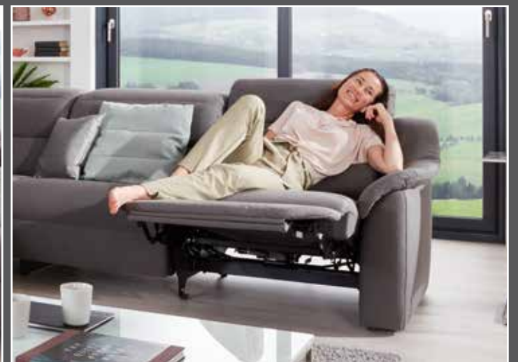
Variante 16 mit Wallfree-Funktion