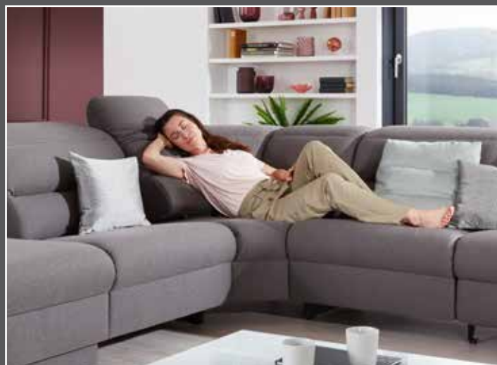
Variante 75 mit Relax-Funktion auf beiden Seiten