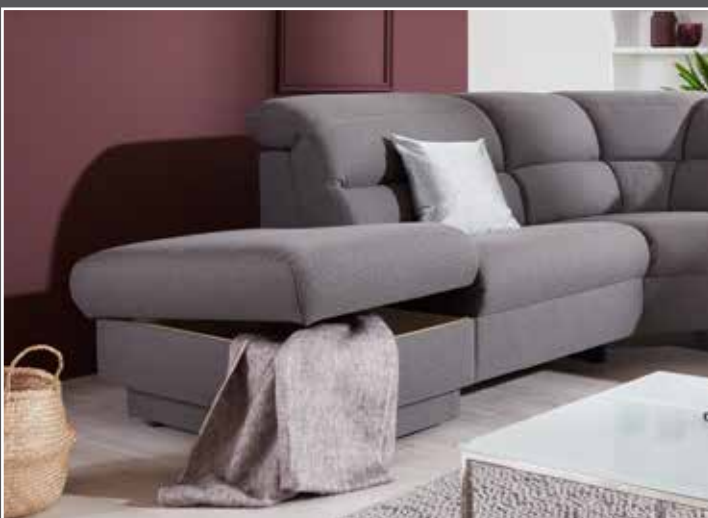
Variante 71 mit Stauraum