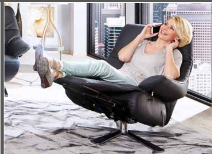
Variante 81 mit Sitzabsenkung - die Armlehne bewegt sich mit