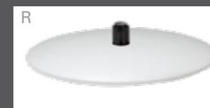
Bezogener Teller (Leder oder Stoff)