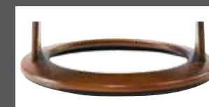
Holzdrehring in mehreren Farben