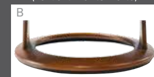
Holzdrehring in Buche (Farbe lt. Beiztonkarte)