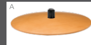
Holzteller in Buche (Farbe lt. Beiztonkarte)