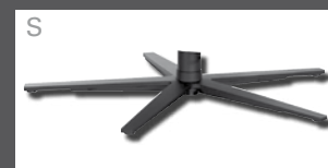
Metall-Sternfuß schmal - verchromt - Edelstahloptik - Anthrazit (pulverbeschichtet)