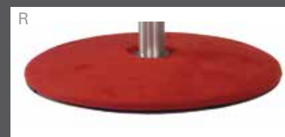
bezogen (bei Leder sind aus technischen Gründen Nähte im Bezug)