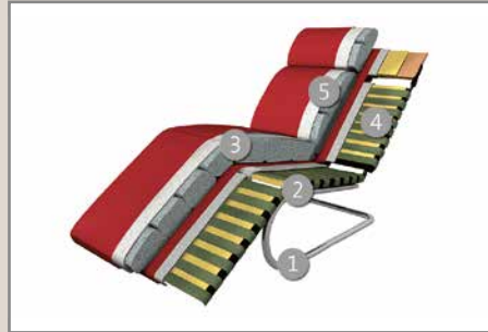
Das Design des hier abgebildeten Querschnitts entspricht nicht dem Modell dieses Katalogblattes.