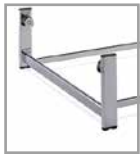
Fußuntergestell Chrom glänzend, gegen Aufpreis