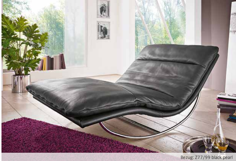
Bezug: Z77/99 black pearl