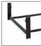
Fußuntergestell schwarz, gegen Aufpreis