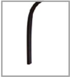
Metallfuß versch. Metallf.