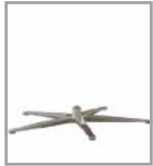
5-Sternfuß versch. Metallf.