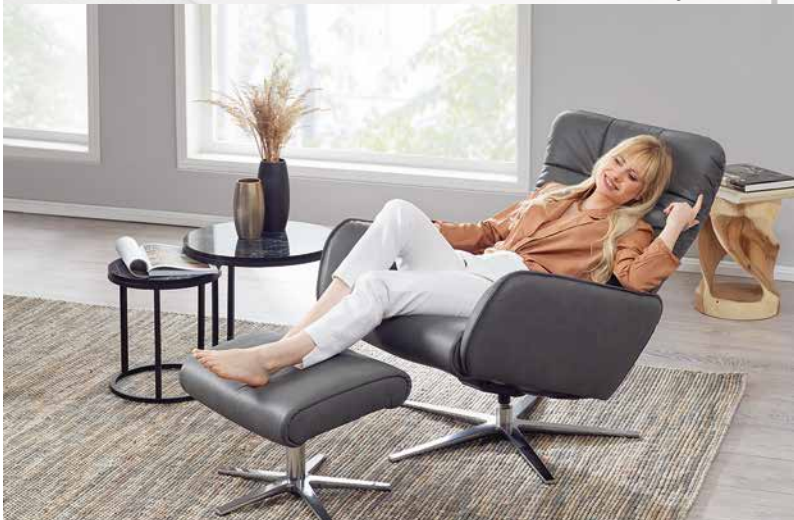
Bezug: Z69/95 anthracite