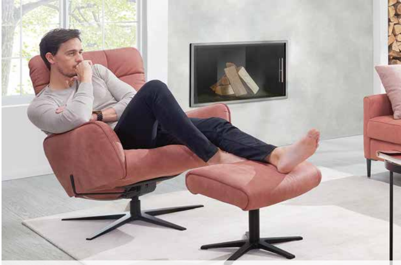
Bezug: Z78/15 blush