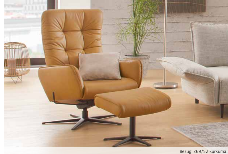
Bezug: Z69/52 kurkuma